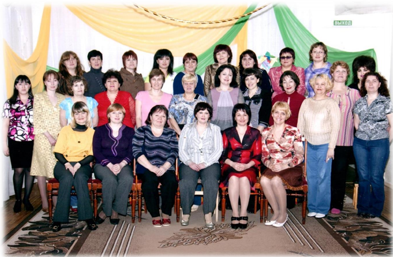
Коллектив ДОУ, 2008г

За время своего развития детский сад всегда шел в ногу со временем и отвечал всем стандартам дошкольного образования.